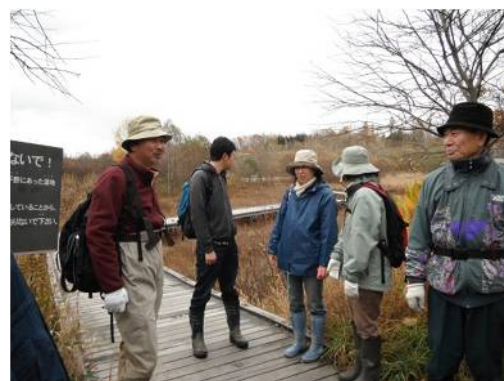
約1時間でヨシの除草作業を終了。