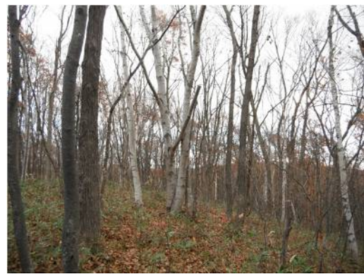
シラカンバとウダイカンバの見分け方は？ 葉の形や幹の出方で、ある程度はわかります。