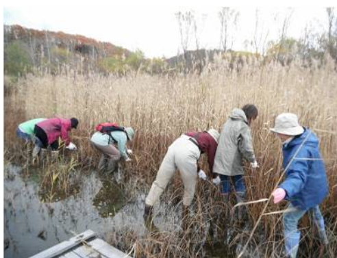
人工湿地：鎌と鋏みでヨシの除草作業を行った。