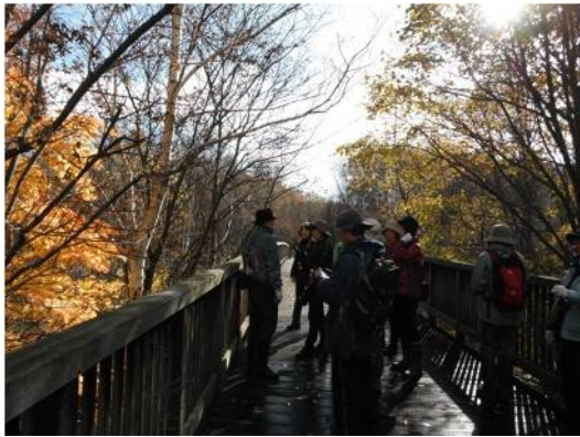
梅の香橋から木々を観察したり、や景色を見渡すことができます。

平岡公園ツリーウォッチングと人工湿地の除草（ヨシ） 11月9日（水） 参加者 18名（一般5） 落ち葉を踏みながら、晩秋の自然林を散策。梅の香橋からは森の上方にコナラの濃い赤褐色の紅葉が見える。今年は平岡公園も、どんぐりの実が不作。平岡、大谷地はコナラの北限にあたります。