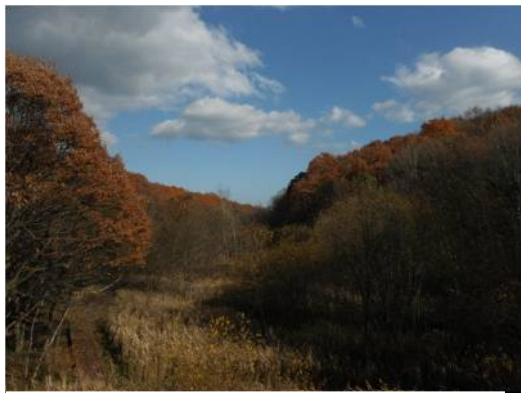
梅の香橋からの上流湿地と自然林 コナラが赤褐色に紅葉