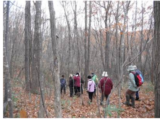
広葉樹はほとんど落葉。