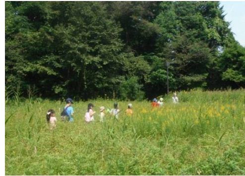
やぶごぎ：自分の背丈よりも高い草の中はたんけん気分楽しいね！