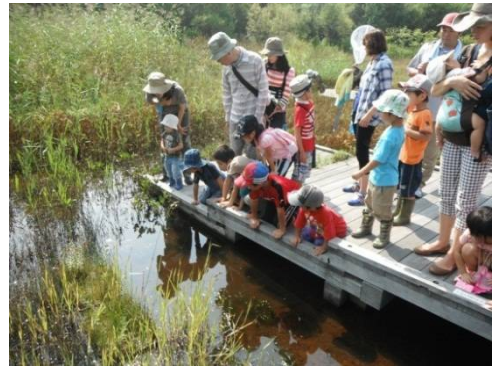
水の中にドジョウがいるよ。