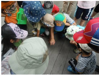
子供たちに人気のダンゴムシ