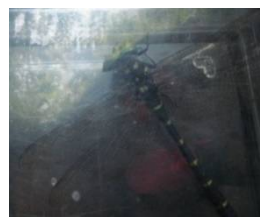
オニヤンマ：上から見ると頭の後ろに鬼の顔があるね！