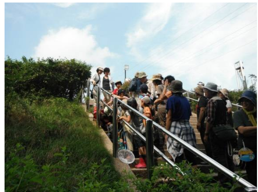
カナヘビがバッタをくわえてる！