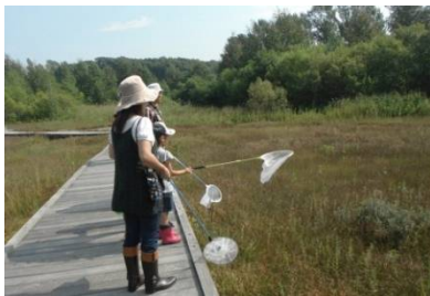
オニヤンマを捕まえるぞ！