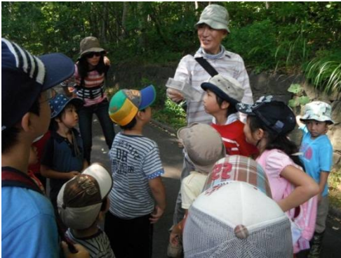
見つけた虫をケースに入れてじっくり観察！

今年は9月になっても残暑が続いている。今日も汗をかきながら自然の中で虫をさがしたり、トンボを見つけたら、ドングリの実が大きくなって、風が吹くと上からぱらぱら落ちてきた。ルンルン、、、虫の音が響いている、、、カンタン(虫の名前)！オニヤンマやオオルリボシヤンマが見れてラッキーでした。