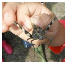
クルマバッタモドキ