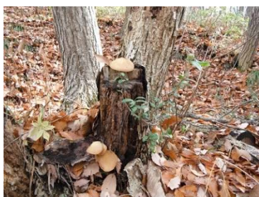
ムキタケ！これは食べられそう：表面の皮がスルッとむけた。