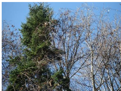
上の方に美味しそうなヤマブドウ の実がぶら下がっています。