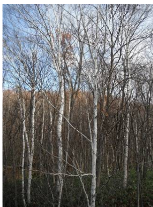
色白で美しいシラカバ。