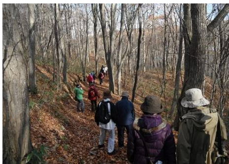
すっかり葉が落ちてすっきり！ 木肌が良く見えます。

秋晴れになり、今年最後のツリーウォッチングを楽しみました。すっかり落葉して森は明るくなり、落ち葉を踏みしめながらの森の散策は気分爽快でした。