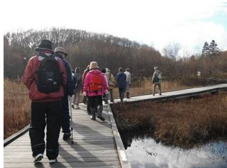
平岡湿原もすっかり秋、エゾノヒツジグサがまだ紅葉していました。