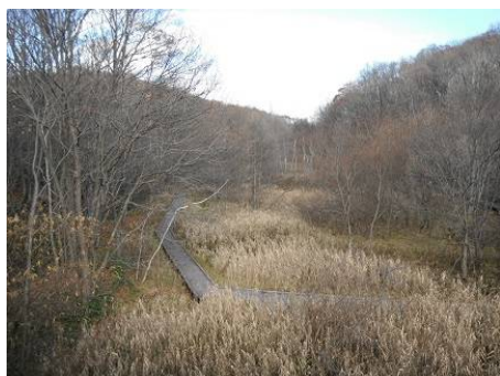
梅の香ばしからの景観