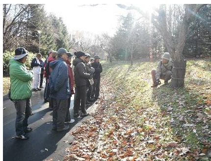
梅の木に網が捲かれているのは？ かじられないように、ネズミ対策。