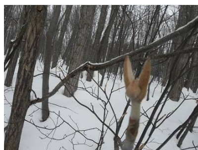
オオカメノキの冬芽