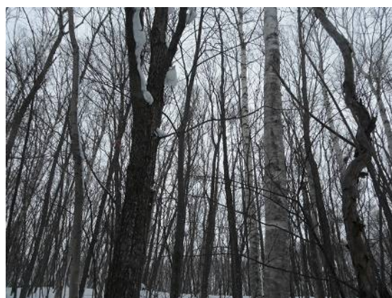
数日前にエゾフクロウを目撃した場所に案内してもらいました。また来るといいな。