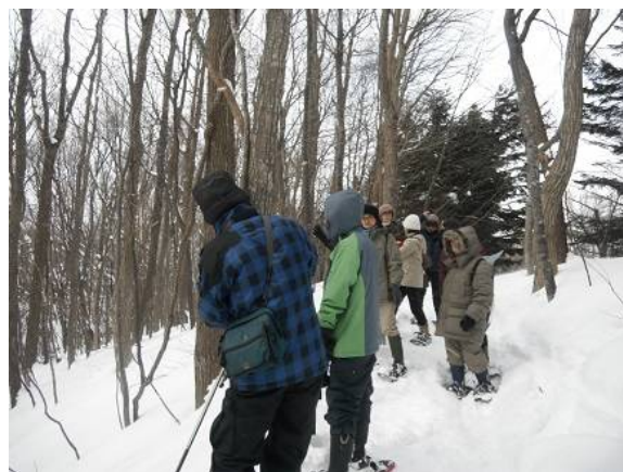
誰かが質問すると、ゆうさんが詳しく解説してくれる、、、あーそうなんだ。