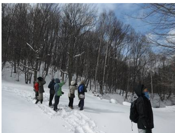
マヒワがいました。