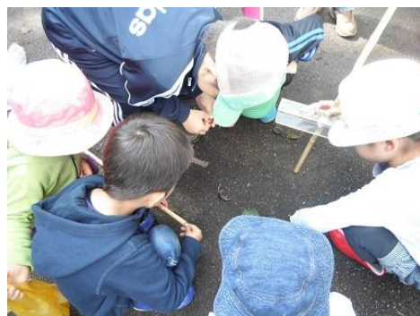
可哀そうなネズミの観察:鼻がとがってるね。