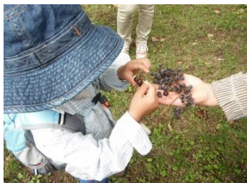
キハダの実:どんな匂いかな？