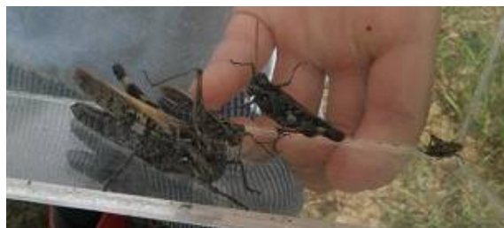
トノサマバッタとクルマバッタモドキを見分けるのは難しいね。