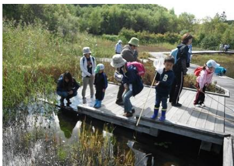
人工湿地:エゾノヒツジグサが咲いてるね。 良く見ると水の中で何か動いているよ。