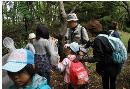
木の周りに色々な虫がたくさんいるね！ ゆうさん、こんな虫見つけたよ！