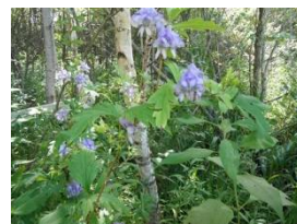
エゾトリカブトの花