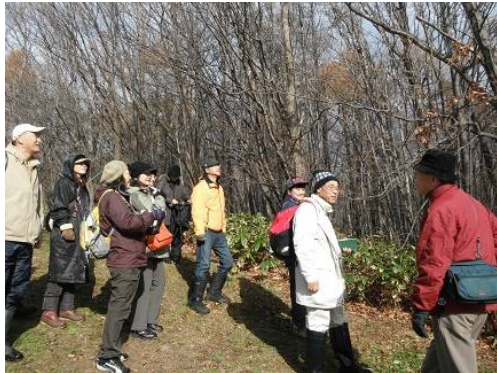
ゆうさんの分かりやすい説明に参加者も納得へえー、、、 そうなんだ。