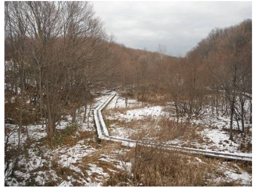
梅の香橋からの「初冬の景観」