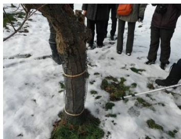
梅の木にネズミの食害を防ぐ金網が巻かれている。