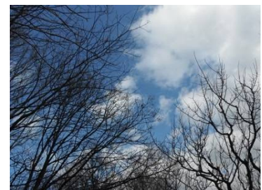
こんな青空も広がりました。