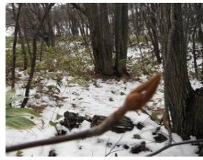
オオカメノキの冬芽