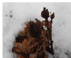
ギンリョウソウモドキ (アキノギンリョウソウ)