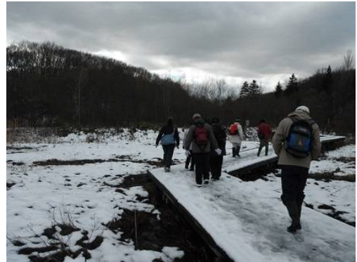
人工湿地：もうすっかり冬景色