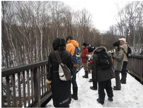
梅の香ばし：予想外に雪が残っていてびっくり

今年は例年よりも早い降雪があり、11月のツリーウォッチングで雪があるのは初めて。落葉してすっかり冬支度ができた平岡の森はひっそりとしていた。越冬中の森を覗きながら、冬芽や木の実を観察したり、思いがけない越冬植物を見つけたり、野鳥の声を聞いたり、上空に舞うノスリ4羽を発見！寒いのも忘れて、初冬の散歩を楽しみました。