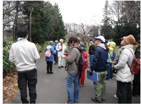
今年最後の樹木観察会、和やかな雰囲気 参加者同士の会話もはずみます。