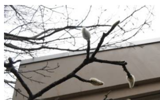
キタコブシの冬芽