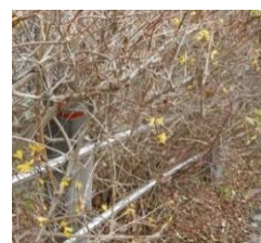
レンギョウが咲き始めた！ 暖冬のせいかな？