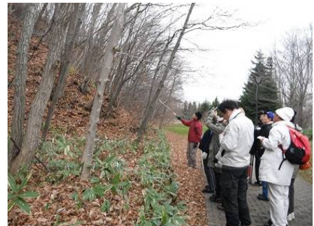
ゆうさんの説明は分かりやすく 勉強になります。