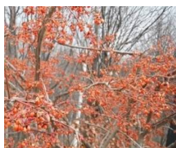
第4駐車場のすぐ脇にあるニシキギ まだ、赤い実がたくさん残っていた。