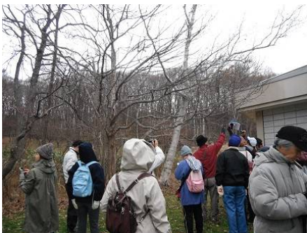
キタコブシの冬芽を観察