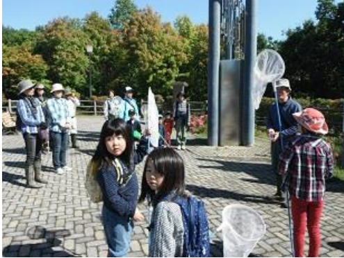
平岡公園第1駐車場に集合

秋晴れの良い天气に恵まれ、虫網を持って「秋のたんけんたい」出発！ トンボや虫、チョウを捕まえてじっくり観察しました。どんぐりやヤマブドウが豊作。気温が上がってくると、アキアカネがたくさん飛んでいた。みんな上手にトンボを捕まえられました。