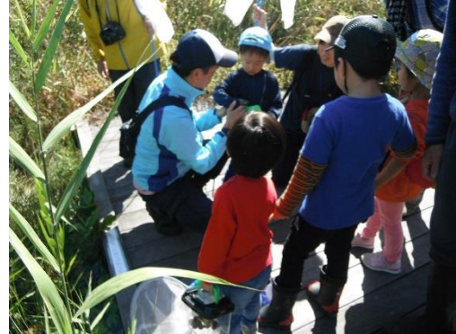
お父さんと一緒に虫をゲット！！