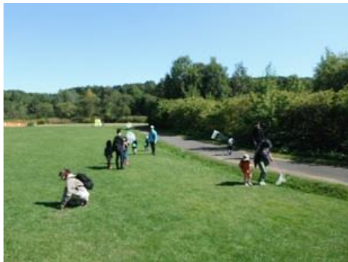
原っぱで虫を捕まえよう。 アキアカネはたくさんいるね。