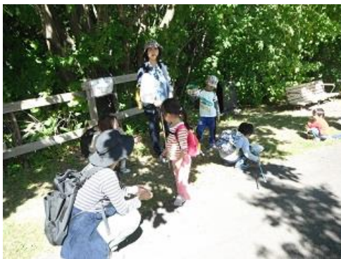
トンボや小さい虫もたくさん捕まえた。