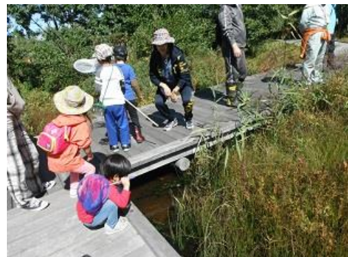
湿地の水辺に何かいるかな？