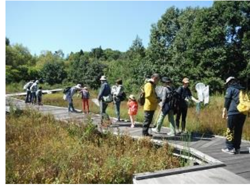
人工湿地:オオルリボシヤンマが飛んでる！