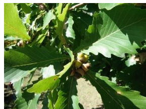
ミズナラのどんぐり