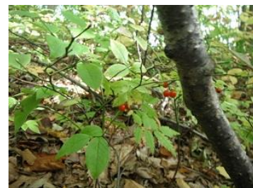
アクシバ(低木)の赤い実