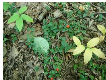
ツルアリオシの赤い実