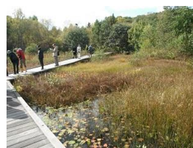
ヒツジグサが紅葉