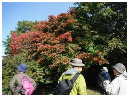
ハウチワカエデの紅葉

昼近くなると暖くなったせいか、トンボの数が増えてきた。雪虫が飛んで冬近しを感じる。