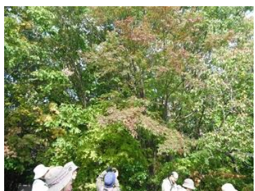
アオダモの紅葉:花がたくさん咲いた割には種が少ない。