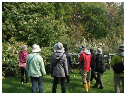
・樹木観察ポイントの一つ ツルウメモドキやホオノキなど