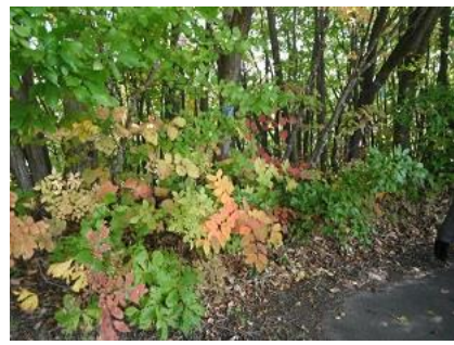
ヌルデ(ウルシの仲間)の紅葉