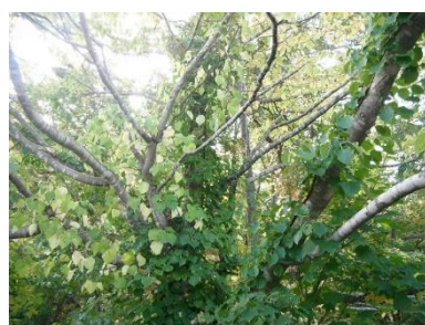
イワガラミの葉は色が抜けて白っぽい ツルアジサイの葉は緑色