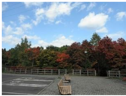
第1駐車場:ニシキギやナナカマド、ハウチワカエデが色づき始めた。