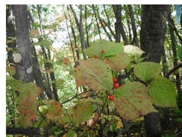
ミヤマガマズミの赤い実