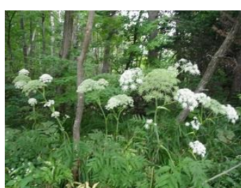
オオバセンキュー