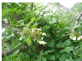
ツルアジサイ(飾り花4枚)