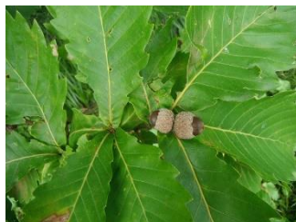
ミズナラのどんぐり