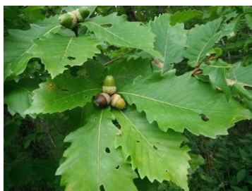
ミズナラ3兄弟 色も形も美しい!