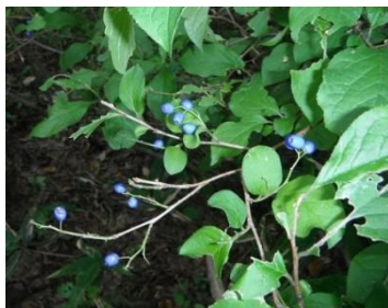
サワフタギ(ルリミノウシコロシ)