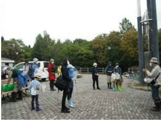
平岡公園第1駐車場に集合 出発前にゆうさんからのお話

木の実や虫を探しながら、森や原っぱをたんけんしました。梅の香ばしの上からすぐ目の高さにあるヤマモミジやカエデ類、どんぐりを観察。はらっぱでバッタの仲間（クルマバッタモドキ）をたくさん見つけて、ケースに入れてじっくり観察。センチコガネ、アキアカネ、エゾアカガエル、エゾリスも見ることができました。