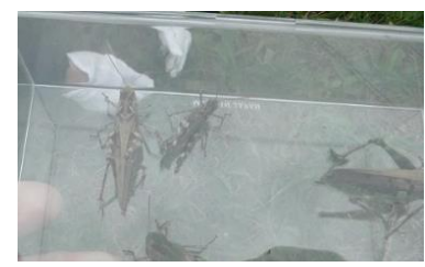
クルマバッタモドキ