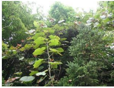
ヤマブドウが豊作