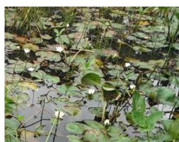
人工湿地のヒツジグサの花