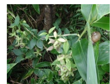
ツルニンジンとエゾマイマイ