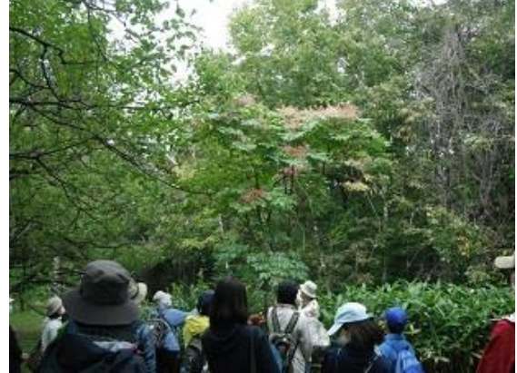
タラノキ(タランボ)の実