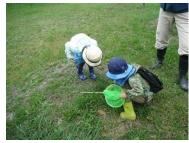
クルマバッタモドキがたくさん！