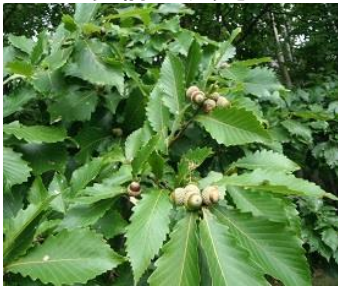
どんぐりが大豊作