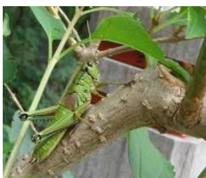
ミカドフキバッタ