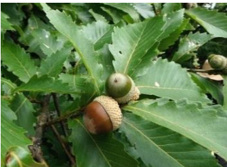
ミズナラのどんぐり