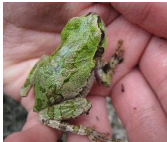
ニホンアマガエル (酪農大学エリアにはまだたくさんいるようです。)