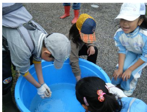
カエルをさわってみた。