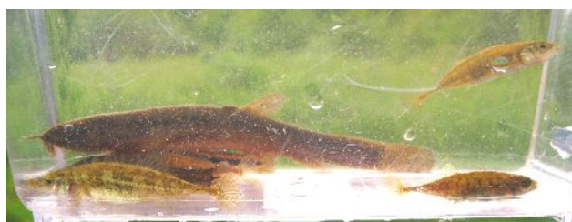
マドジョウ エゾホトケドジョウ トンギョ