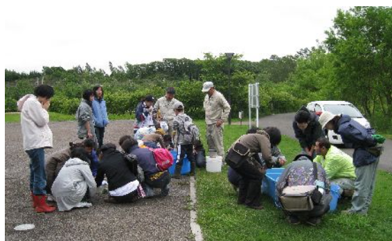
みんなでカエルの観察