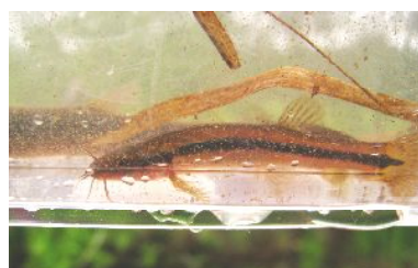
エゾホトケドジョウ