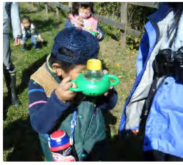
大きく見えるよ！上からも、横からもぞいて、じっくり観察します