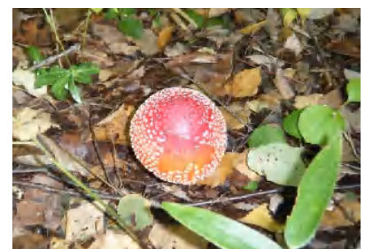
ベニテングダケ(毒がある)