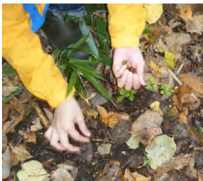
どんぐりがたくさん