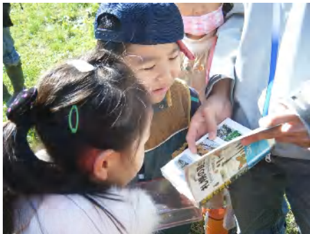
昆虫図鑑にはバッタの種類がたくさん、のっている。