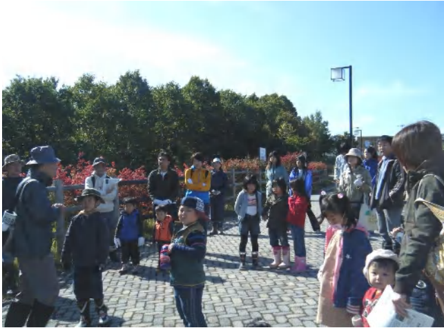
平岡公園の第1駐車場に集合

台風一過で秋晴れになり、集まったみんなで秋の森たんけん！赤い実、紫色の実、どんぐりがたくさん落ちていました。バッタ(ヒナバッタ、クルマバッタモドキ、ミカドフキバッタ)、エンマコオロギ、ヒラタシデムシ、カナヘビ、赤いキノコはベニテングダケとタマゴタケ、毒があるのはどっちかな？