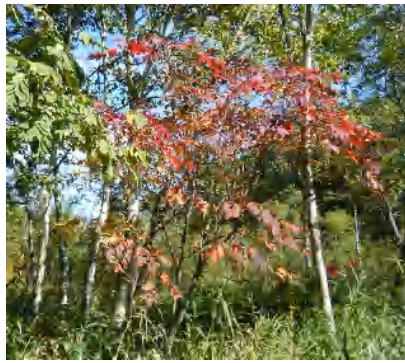
ヤマウルシが真っ赤に紅葉