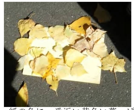
紙の色に一番近い黄色い葉っぱはどれかな？