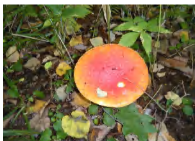
タマゴタケ(食べられる)