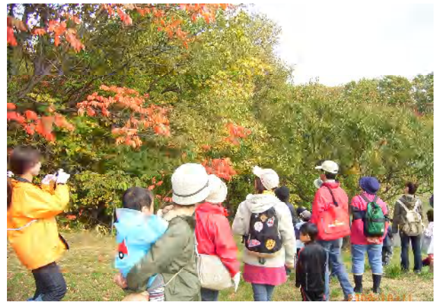
ヌルデ(ウルシ科)の紅葉