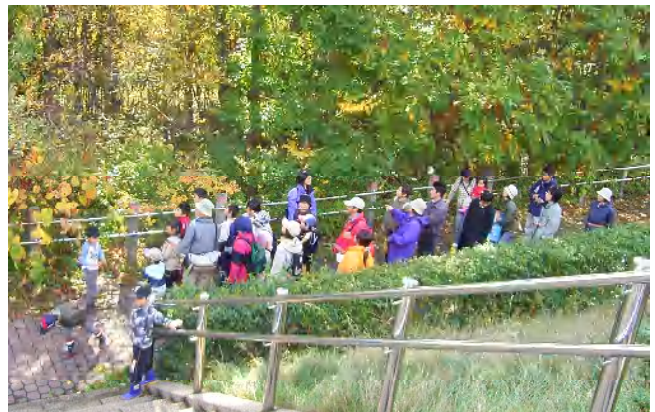
ヤマブドウの実はまだあるかな？