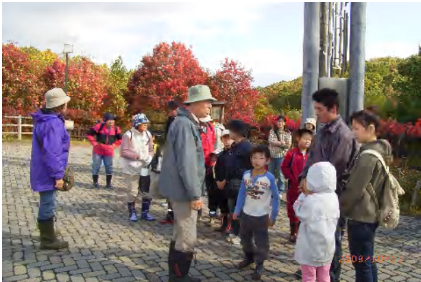
ナナカマドがまっ赤に紅葉

色づき始めた秋の森をたんけん。気温が上がったせいか、色々な虫たちが顔を出しました。