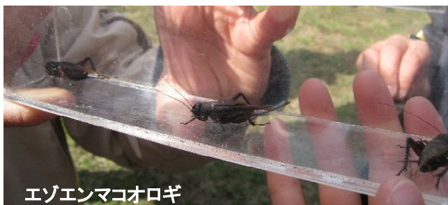
エゾエンマコオロギ