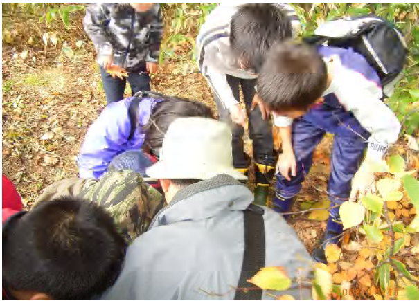
ゆうさん、これなんだろう？