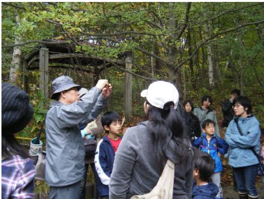
キタコブシの赤い実は白い糸にぶら下がっているよ。