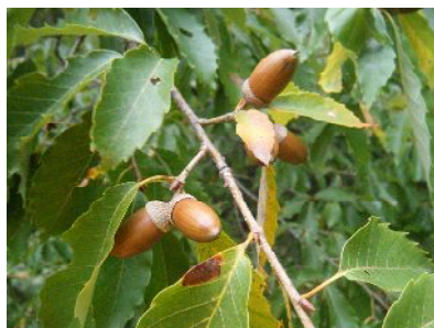
コナラ 細長いどんぐり 葉柄が長いね