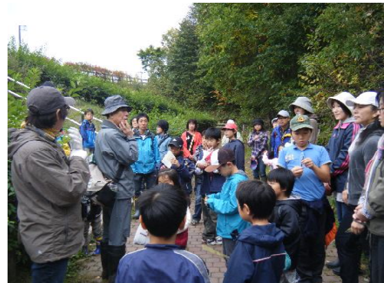
公園を一回りした後もみんな元気です。今日のたんけんをふり返る。