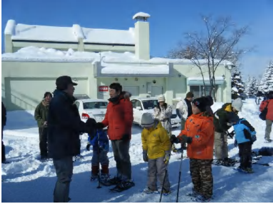
管理事務所前から出発

真っ青な空、真っ白な雪、澄み切った空気、、、。スノーシューを履いて、新雪をラッセルしながら冬の森ウォッチングを楽しみました。シジューカラ、ゴジューカラ、コゲラ、アカゲラ、、、美しいさえずりが響き、鳥たちは相手探しに大忙しです。カラマツに新しいクマガラの大きな採餌痕が5穴！！シラカバにはセミの抜け殻、、、。