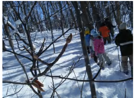
オオカメの木のウサギ(冬芽)