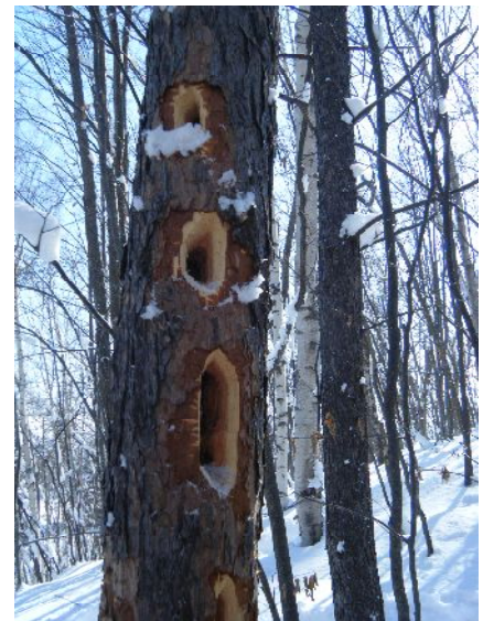
新しいクマガラの大きな採餌痕