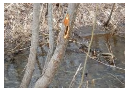
クマゲラノ採餌痕