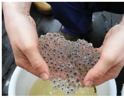
ぷるぷるゼリーみたいだね。