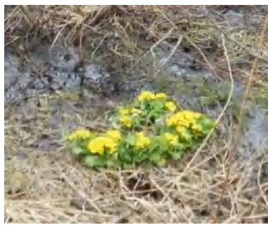
エゾノリュウキンカ