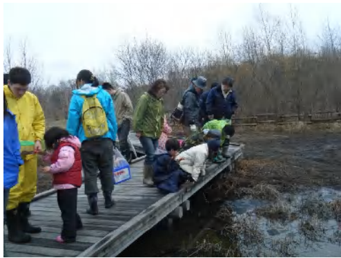
カエルの卵がたくさん見えるね。