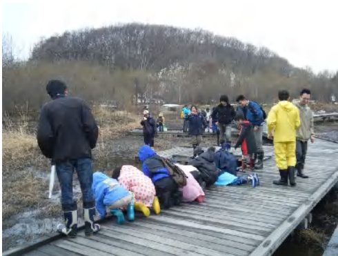
エゾアカガエルはいるかな？ 人工湿地エリアで約85個の卵塊を確認

雨模様でしたが、親子連れや元気な子どもたちが集まり、大学生のお兄さんお姉さんと一緒に春のたんけんを楽しみました。人工湿地にはエゾアカガエルの卵塊がたくさん！木道から見える小さなミズバショウが春の訪れを囁いているようでした。