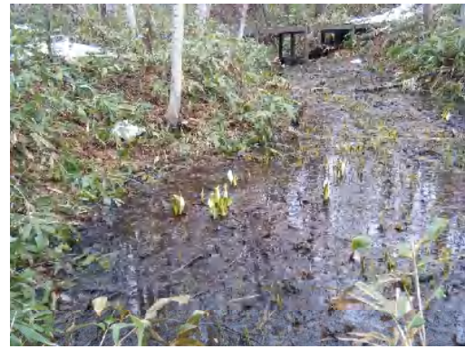
ミズバショウ 上流湿地の木道から