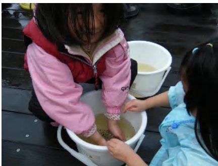
エゾアカガエルの卵をさわってみた。