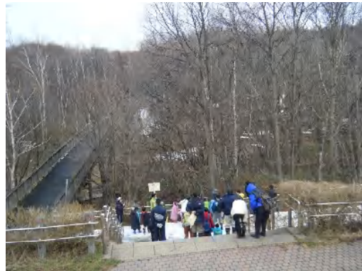
駐車場から出発、左手に「梅の香ばし」 まだ雪が所々に残っている。