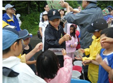
じゃんけん！何か楽しそうだね。