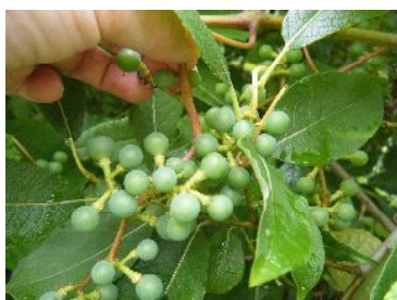
ヤマブドウの実がたくさくさん