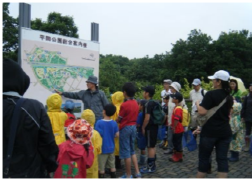
ゆうさんから出発前のお話

小雨まじりの天気でしたが元気な子供たちが集まり、湿地の木道やはらっぱをたんけん。大きなカタツムリやモノアラガイ、ヤゴから出てきたばかりのオニヤンマがあちこちで見られました。小川ではタモ網でフクドジョウ(3) やスナヤツメ(5)、イバラトミヨ(1)、トンボのヤゴ、トビケラやカワニナ、ヨコエビ、小さなエゾアカガエルも見つけました。