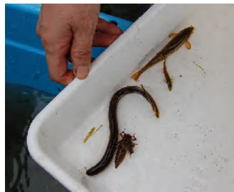
大きなスナヤツメ(18cm) フクドジョウ、ヤゴ、イバラトミヨ