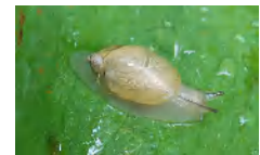
オカモノアラガイ