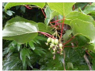
コクワの実もなってるよ！