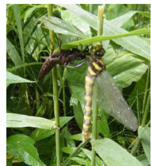
オニヤンマの羽化