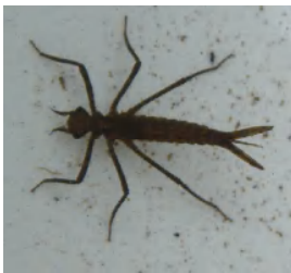
イトトンボのヤゴ