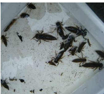
オニヤンマのヤゴ