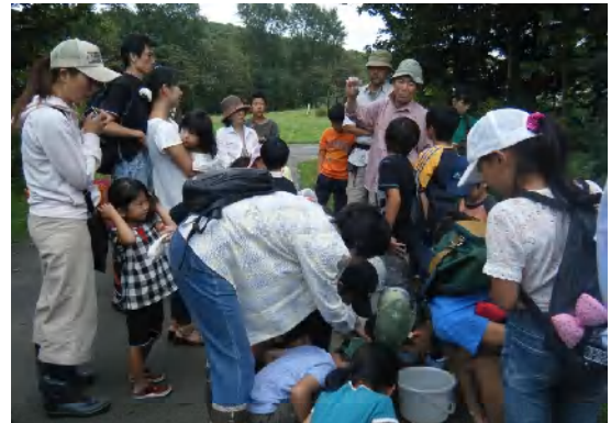
同じ種類の生きものをバケツや水槽 に入れて観察しました。