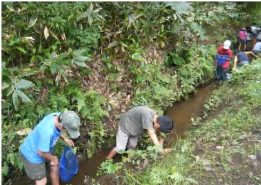
タモ網の使い方も慣れてきました。