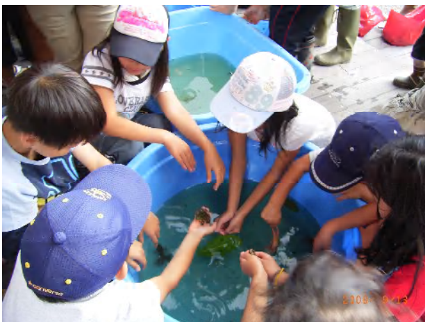
魚よりカエルに夢中