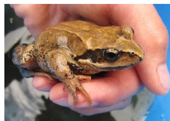
昔から棲んでいる エゾアカガエル