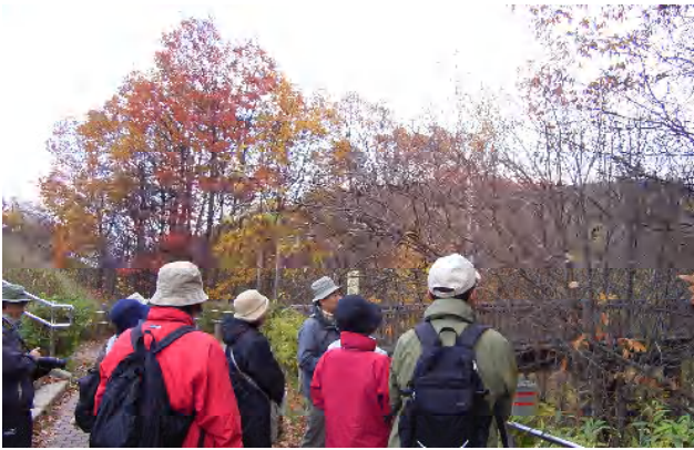
コナラがまっ赤に色づきました。