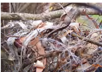
巣材は色々なものが混じっている