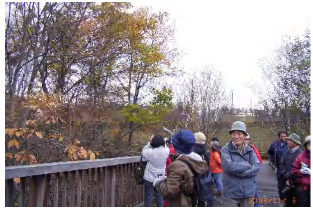
前日は雪がちらつきましたが、今日は風もなく穏やか今年最後のツリーウォッチングを楽しみました。