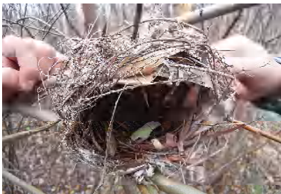
ヒヨドリの巣かな