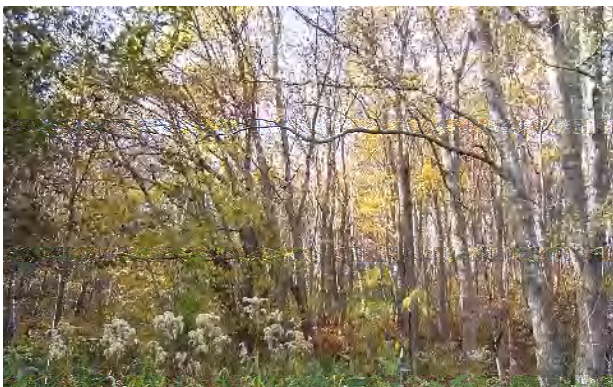
葉が落ちて森の中は明るくなりました。