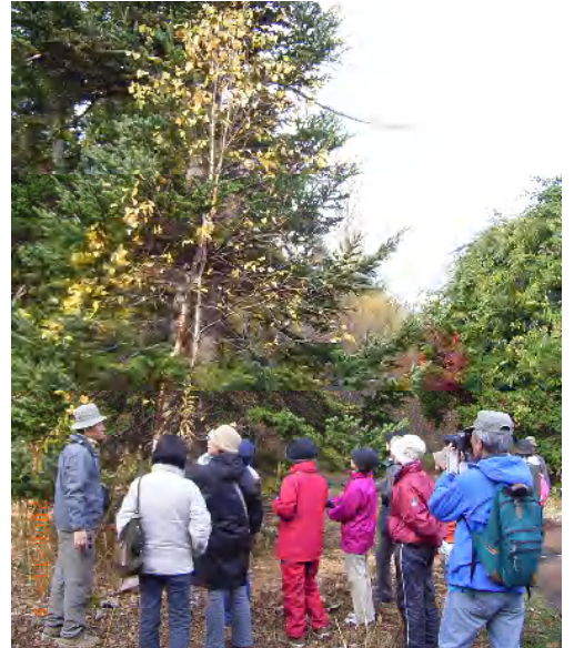
今日は自然林、人工湿地、原っぱの奥までぐるっと一回り、ゆっくり散策しました。