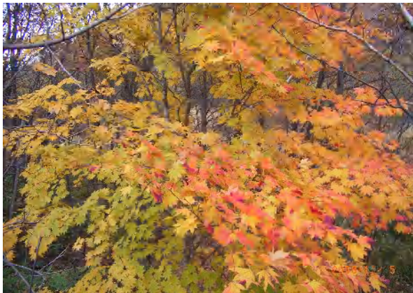
ハウチワカエデの紅葉、色のコントラストが美しい