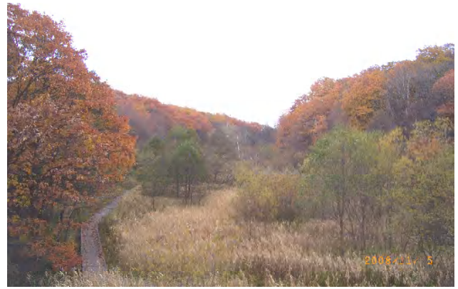
梅の香橋からの眺めはすっかり晩秋