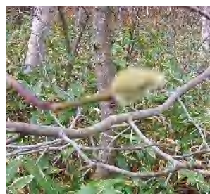
キタコブシの冬芽