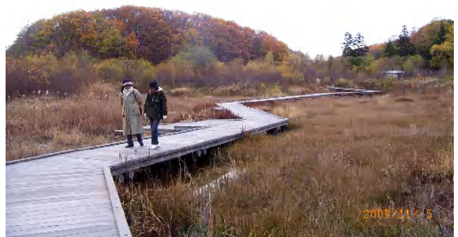
人工湿地も秋いろ