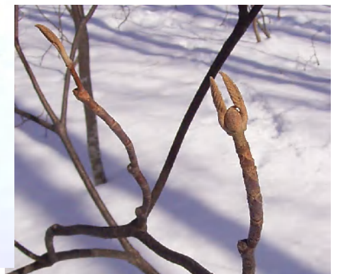
オオカメノキには、かわいいウサギさん