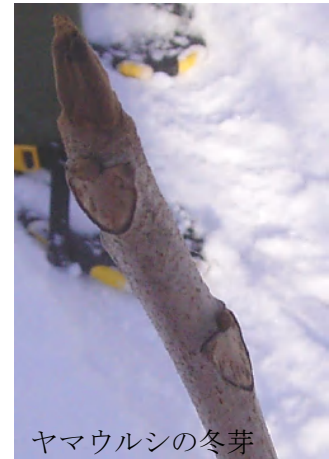
ヤマウルシの冬芽