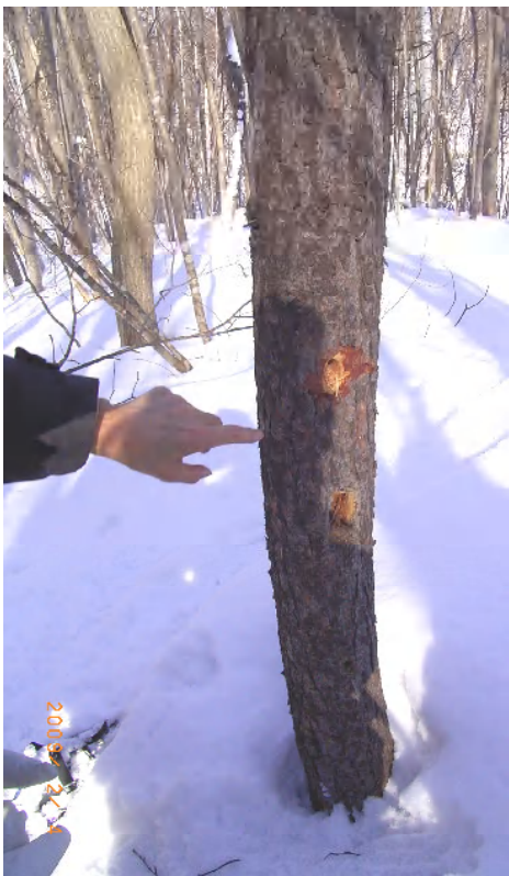
カラマツの木に、まだ新しいクマゲラの採餌痕！！発見。