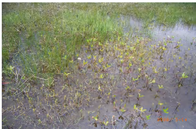
湿地にはミツガシワの花が咲き始めた