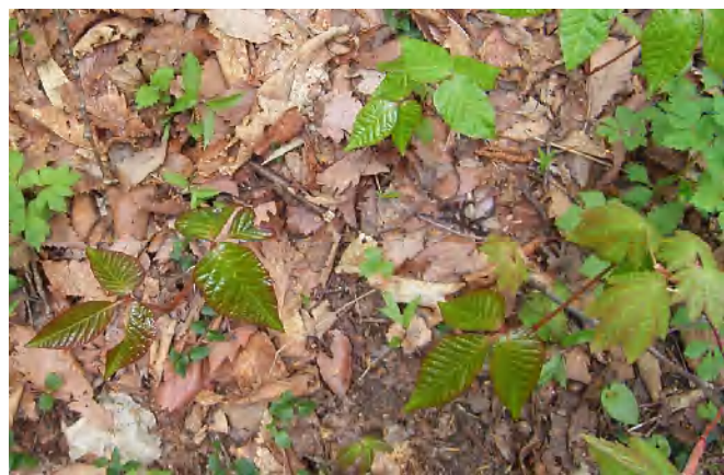
三枚葉のウルシの葉が光っています