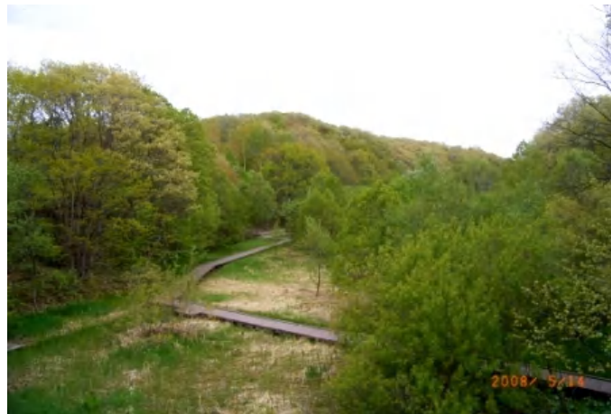
うめのか橋からの景観