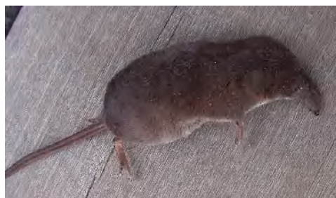
トガリネズミの屍骸