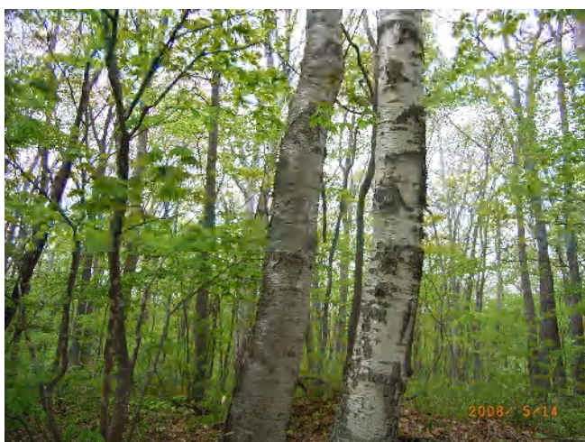
ウダイカンバとシラカバ