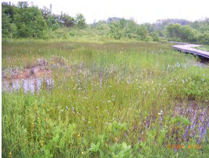
ヤナギトラノオ、サギスゲ、フトイ、、、