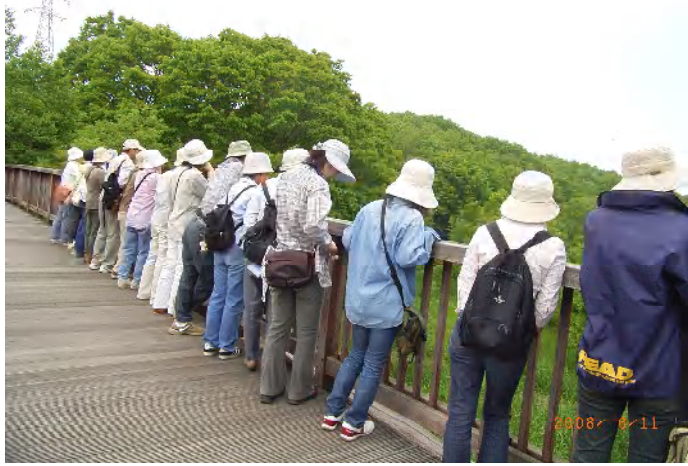
「梅の香橋」から若葉の森の景観を満喫しました

新しい顔ぶれも加わり、大勢で初夏の森を楽しみました。 ササバギンラン、イチヤクソウ、ヤマブドウやコクワの花もそろそろ ヨツボシトンボが湿地で忙しそうに卵を産み付けていました。