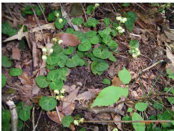
ジンヨウイチヤクソウ