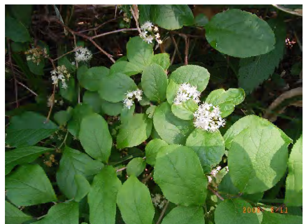
サワフタギ (ルリミノウシコロシ)