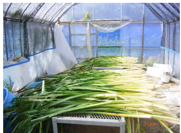
今日の収穫・ガマの葉 水気を取ってから干します