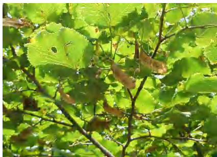
オオバボダイジュ