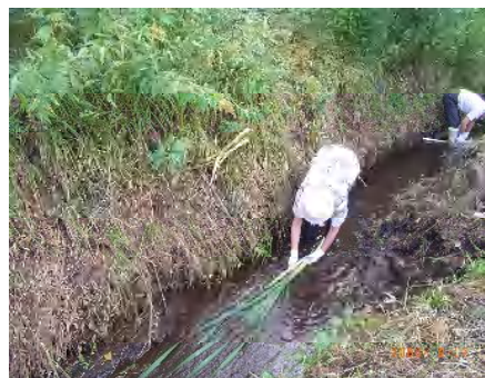
ガマの葉を1枚ずつはがしてぬめりを取ります