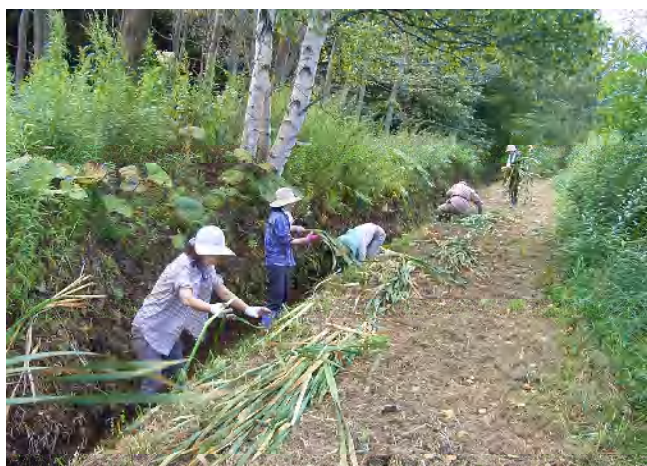
小川でがまの葉のぬめり取り作業風景 11名で手際良くできました。