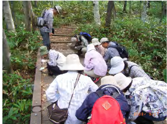
シラカバのタネをじっくり観察中