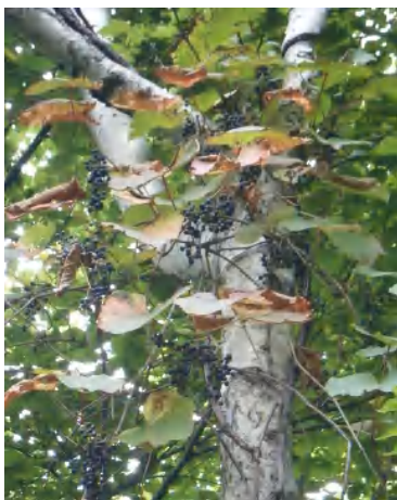
ヤマブドウの实がたくさん