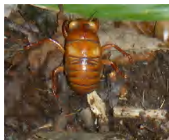
エゾゼミ 羽化できるかな？