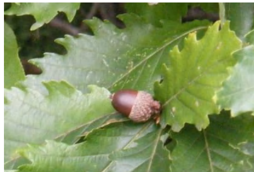
ミズナラ コナラよりドングリがずんぐり大きい