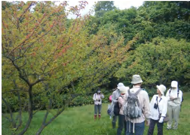
梅が色づき始めた。

平岡公園の森が少しづつ、色づいてきました。ヤマブドウ、コクワ、キタコブシ、ミヤマガマズミ、サワフタギ、ミズナラ、コナラ、、、秋の木の实ウォッチングを楽しみました。赤ちゃんの握りこぶしに似たキタコブシのタネが目をつひきます。ツリバナやマユミ、コマユミ、ニシキギ、オオツリバナの实の見分け方も教えてもらいました。天気予報が外れ、急な大雨で、ガマ刈りはできませんでした。