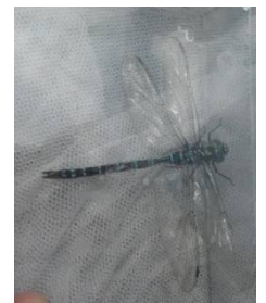
オオルリボシヤンマ