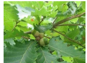
ミズナラのどんぐりが大きくなってきた。