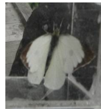
オオモンシロチョウ