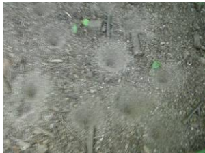
アリ地獄：ウスバカゲロウの幼虫が潜んでいるらしい。