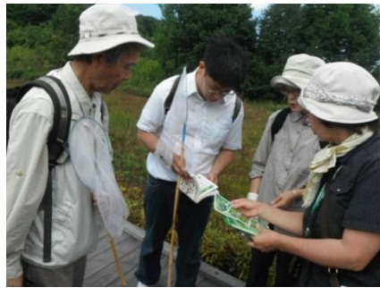
問田さんから詳しい解説を聞く