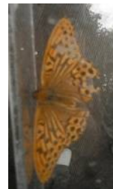
ミドリヒョウモン