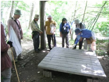
木のテーブルの周りにアリ地獄を発見!