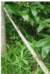
仲良く日向ぼっこ