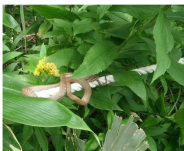
アオダイショウの幼体