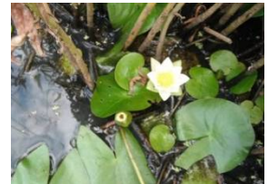
人工湿地にはエゾノヒツジグサの花があちこちで開花