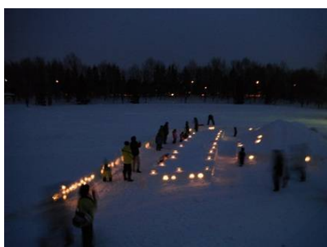
雪山から見るとこんな感じです。