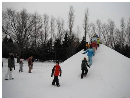
雪山のおしりすべりは、良く滑って面白い。