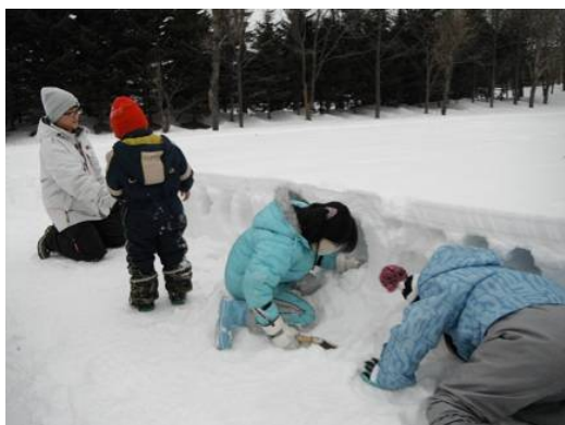
雪の壁に好きな形を掘って、暗くなってからキャンドルを置いて灯をともしました。

冬休み平岡公園にぎわいフェスタ 2013 1月12日(土) 参加者70名(一般42、) 寒い冬の1日、大勢の親子連れや子供たちが集まり、平岡公園で雪遊びを楽しみました。 酪農大学の学生さんが協力してくれて、イベントを盛り上げてくれました。暗くなってからも、 キャンドルの灯りのそばで、そりすべりを楽しんでいる子供たちがたくさんいました。