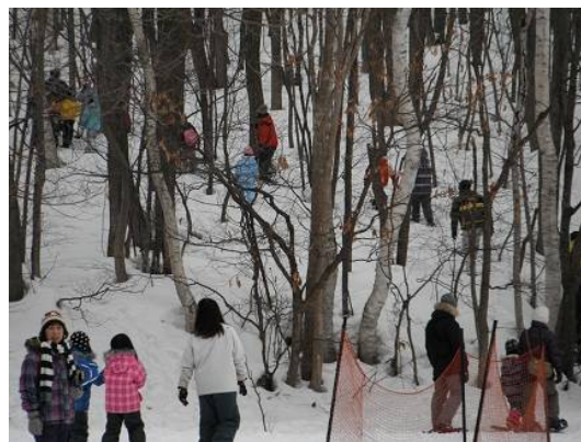
スノーシューが脱げて、悪戦苦闘する小さい子供もいましたが、最後まで頑張りました。