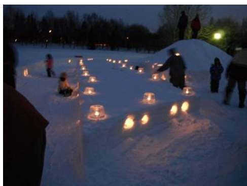
みんなでキャンドルに灯りを灯しました。