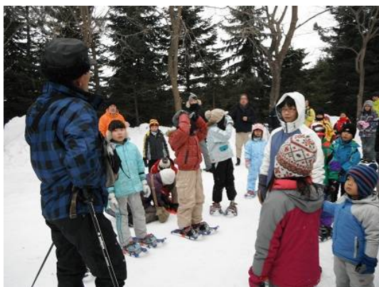
初めてスノーシューをはいた子供たちがほとんどでした、冬の森たんけん出発。