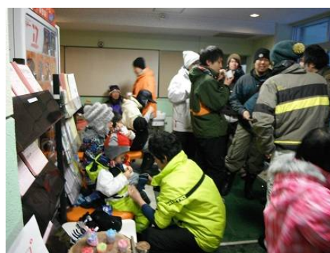
美味しいお汁粉を食べて一休み。