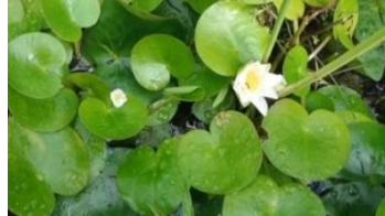
まあるい葉っぱはトチカガミ 大きい花はエゾノヒツジグサ