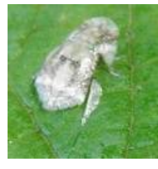
ヨコバイ科のミミズク